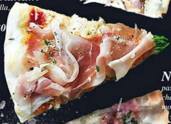
NO.14 Four cheeses pastrami(Ham),blue cheese, cheddar,parmesan, mozzarella,mascarpone' 360.- | 440.- | 630.- S / M / L