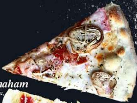
NO.12 Marble ham,bacon,pepperoni, cream sauce,mushroom, mozzarella 290.- | 395.- | 540.- S / M / L