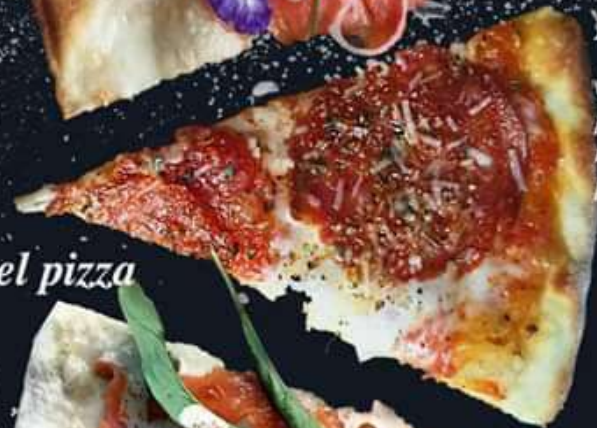
NO.17 Jewel pizza smoked salmon, cream of ebiko, wasabi,salmon roe, rocket,caper,dill, mascarpone 420.- | 510.- | 690.- S / M / L